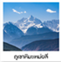
ภูเขาหิมะเท๋อหมิง