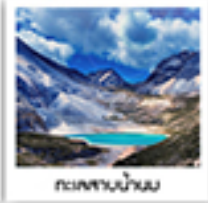
ทะเลสาบน้ำนม