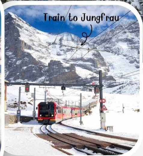
Train to Jungfrau