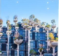
Tian An 1,000 Trees Square