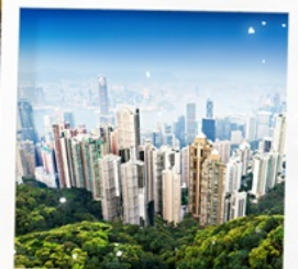
จุดชมวิวกาอิกตอเรีย