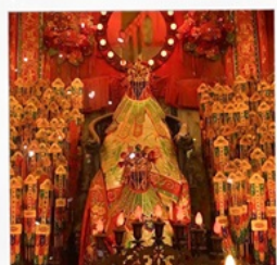
เจ้าแม่กวนอิมวัดสองฮา