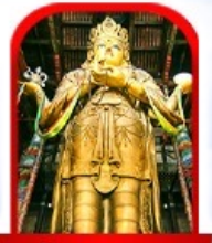
วัดกานดา