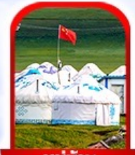
หมู่บ้าน พื้นเมือง