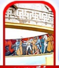
อนุสาวรีย์ โซซาน