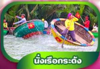
นั่งเรือกระดง