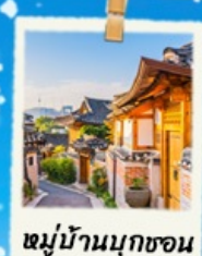
หมู่บ้านนุกซอน