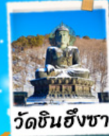
วัดชินฮังซา