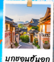
มุกซอนฮันอก