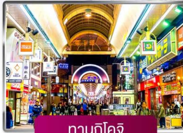
กานุกิโคจิ