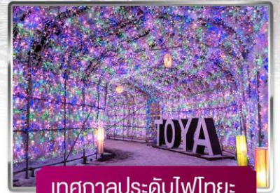
เทศกาลประดับไฟไทยะ