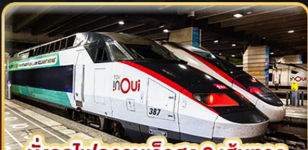
นั่งรถไฟความเร็วสูง 2 เส้นทาง PARIS - LYON & VENICE - ROME