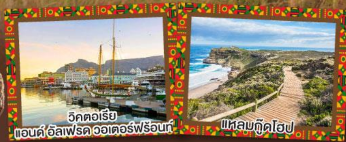
วิกตอเรีย แอนด์ อัลเฟรด วอเตอร์ฟรอนท์