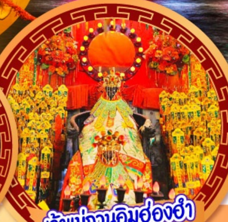
เจ้าแม่กวนอิมฮ่องฮ่า

นมัสการเจ้าแม่กวนอิมฮ่องฮ่า หมุนกังหันรับโชคลากเงินทองที่วัดแชงหมิว ขอพรความรักกับผู้เต่าจันตรา วัดหวังต้าเซียน