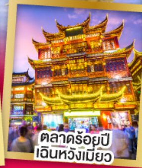
ตลาดร้อยปี เงินหวังเหมียว