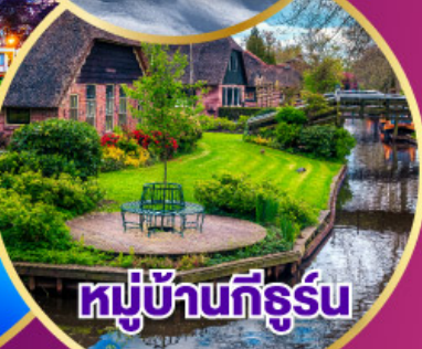
หมู่บ้านที่รูร์

เดินทาง 30 เม.ย.-09 พ.ค. 68 03-11 พ.ค. 68