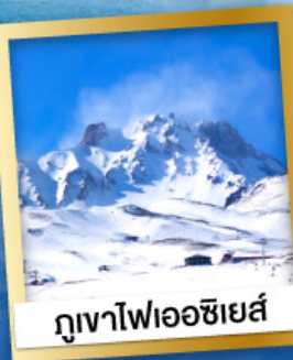
ภูเขาไฟเออซีเยส์