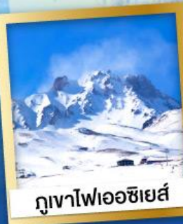
ภูเขาไฟเอซียส์

ฉลองเค้กต์ดาวน์ ข้ามปีที่เมืองอิสตันบูล เมืองที่ใหญ่ที่สุดของตุรเคีย