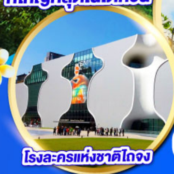
โรงละครแห่งชาติไทจง