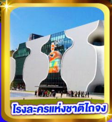
โรงละครแห่งชาติไทจง