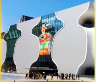
โรงละครแห่งชาติไทจง