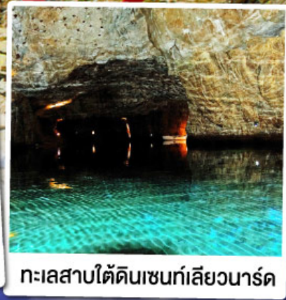
ทะเลสาบไ้ดินเซนที่เล็ยวาร์ด

ล่องเรือชมทะเลสาบไ้ดินเซนที่เล็ยวาร์ด ทะเลสาบไ้ดินลึกลับ สุดUnseenแห่งสวิตเซอร์แลนด์