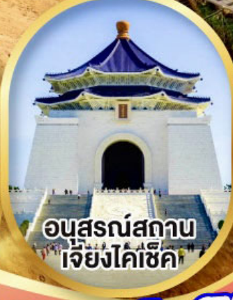
อนุสรณ์สถาน เจียงไคเช็ค