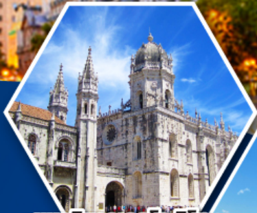
มหาวิหารเจอโรนิโม