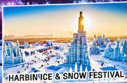
HARBIN ICE & SNOW FESTIVAL