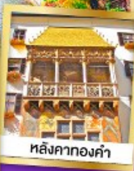
หลังคาทองคำ