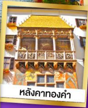
หลังคาทองคำ