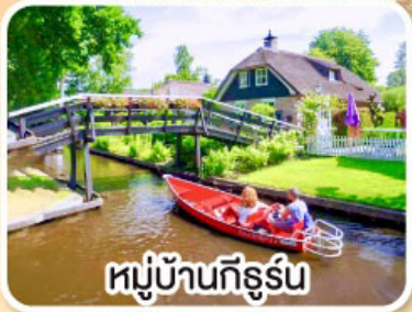
หมู่บ้านกังรีร์น