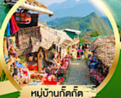
หมู่บ้านก๊ตก๊ต