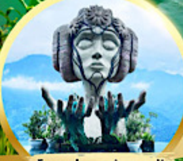
โมอาน่า ซาปา คาเฟ่