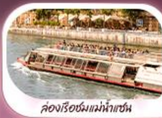
คลองเรือชมแม่น้ำแซน