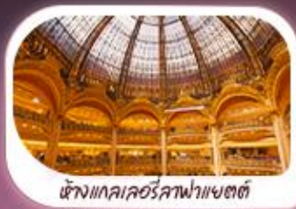
ห้างแกลเลอรีสภาพาแซตต์