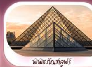
พิพิธภัณฑ์ลูฟร์