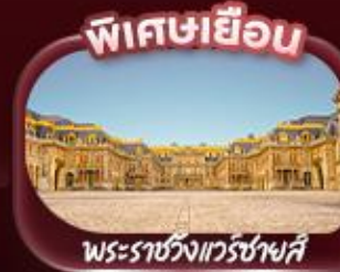
พิเศษเยือน