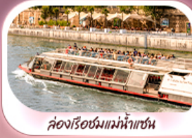
ล่องเรือชมแม่น้ำแซน