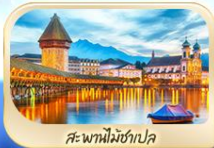
สะพานไม้ชาเปล