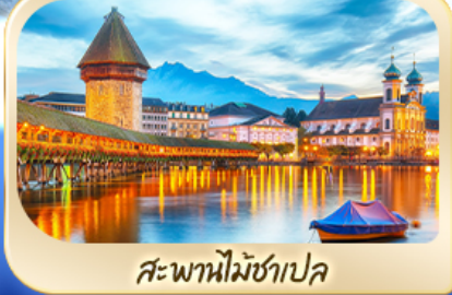
สะพานไมซ์าเปล