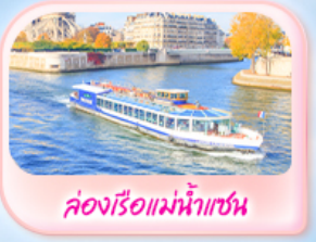
คลองเรือแม่น้ำแซน