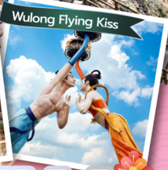
Wulong Flying Kiss