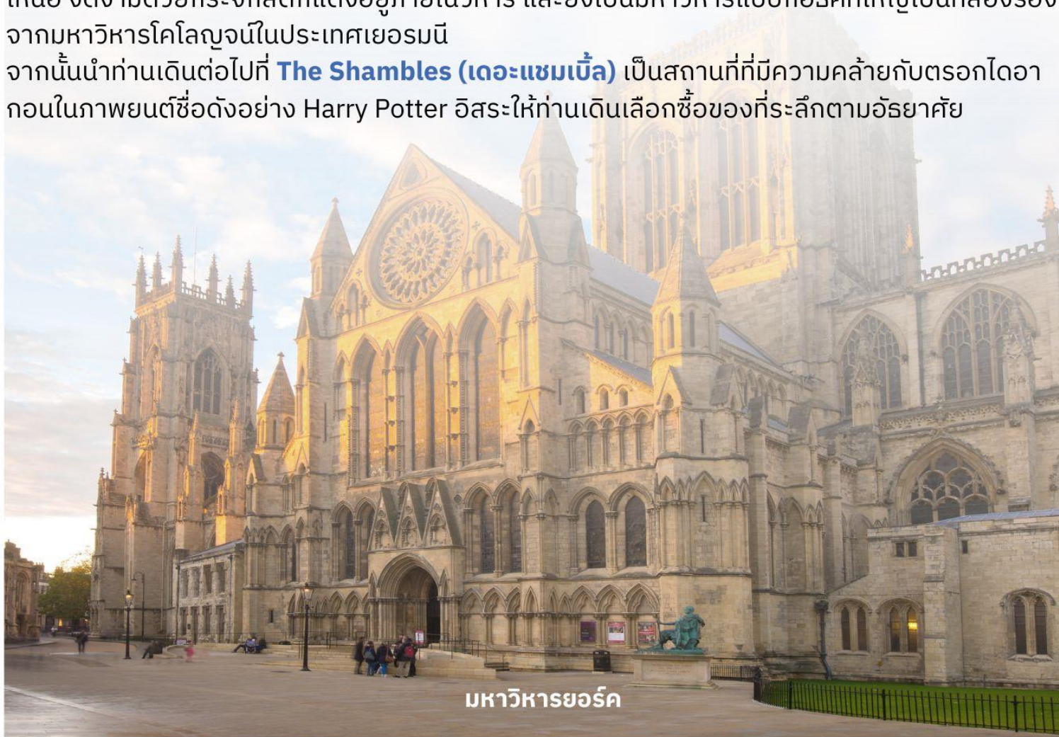
มหาวิหารยอร์ก

จากนั้นนำท่านเดินทางต่อไปที่ The Shambles (เดอะแซมเบิล) เป็นสถานที่ที่มีความคล้ายกับตรอกไดอากอนในภาพยนตร์ชื่อดังอย่าง Harry Potter อีสาระให้ท่านเดินเลือกซื้อของที่ระลึกตามอัธยาศัย