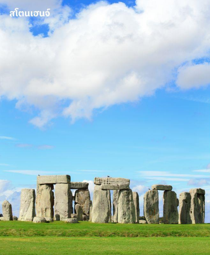
สโตนเฮนจ์

จากนั้นนำท่านเดินทางสู่ ซาลส์เบอรี ใช้เวลาเดินทางประมาณ 1 ชั่วโมง เป็นทุ่งหญ้าอันกว้างใหญ่ที่เป็นที่ตั้งของหนึ่งในเจ็ดสิ่งมหัศจรรย์ของโลกยุคกลาง จากนั้นนำท่านเข้าชมสโตนเฮนจ์ วงหินปริศนาแห่งเกาะอังกฤษนับเป็น สร้างขึ้นราว 3,000 ปีก่อนหน้านี้ ไม่เป็นที่ทราบแน่ชัดว่าทำไมสิ่งนี้จึงถูกสร้างขึ้นมา แต่จากลักษณะของการก่อสร้างทำให้ทราบว่าผู้ก่อสร้างต้องมีฐานอำนาจอยู่ไม่น้อย เนื่องจากหินที่ตั้งอยู่ 112 ก้อนนั้นไม่ใช่หินที่มีลักษณะทางกายภาพที่ใกล้เคียงกับหินที่อยู่ในบริเวณนี้ ถือว่าเป็นหนึ่งสถานที่ที่ยังคงมีปริศนาเกี่ยวกับว่าใครเป็นผู้สร้าง สร้างได้อย่างไร และสร้างมาเพื่ออะไร ?