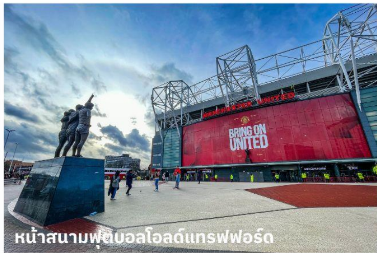
หน้าสนามฟุตบอลโอลด์แทรฟฟอร์ด