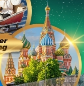
St. Basil's Cathedral