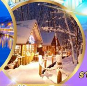
หมู่บ้านเทพนิยาย นิงเกิลเทอเรส