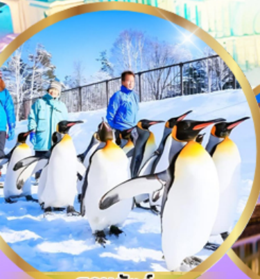
สวนสัตว์ อาซาฮิยาม่า