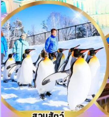
สวนสัตว์ อาซาฮิยาม่า