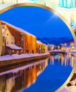
คลองโอตารุ