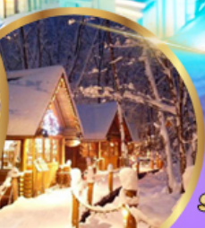
หมู่บ้านเทพนิยาย นิงเกิ้ลเทอเรส