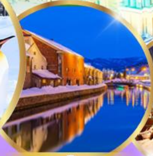
คลองโอตารุ