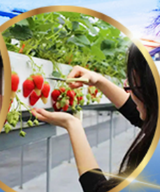
บุฟเฟต์ สตอเบอร์รี่