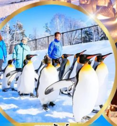
สวนสัตว์ อาซาฮิยาม่า