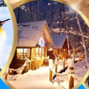
หมู่บ้านเทพนิยาย นิงเกิลทอเรส