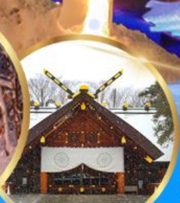
ศาลเจ้า ออกโทโต

เดินทาง 04 - 09 กุมภาพันธ์ 68 05 - 10 กุมภาพันธ์ 68