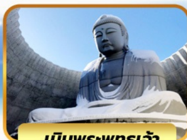
เป็นพระพุทธรเจ้า

05-10, 12-17, 19-24 พย. 26 พ.ย. - 01 ธ.ค. 67