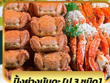
บึงย่างมันตะ [ปู 3 ชนิด]