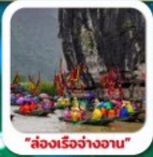
"-song Reo Hang An"