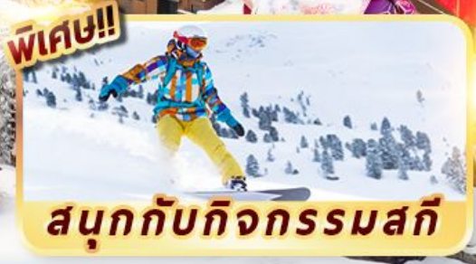
สนุกกับกิจกรรมสกี