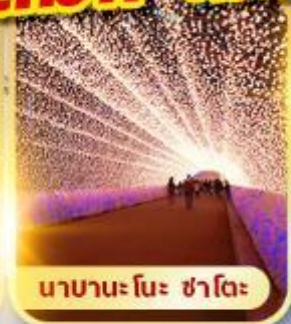
นาเบะ โนะ ซาโตะ