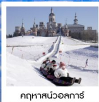
ฤดูหาวสนวอลการ