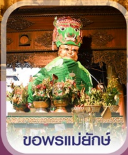
ขอพรแม่ยักษ์

✈️ คอนเฟิร์มออกเดินทาง ทุกพีเรียด 2 ท่านขึ้นไป