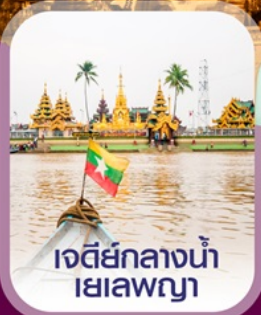
เจดีย์กลางน้ำ เยลพญา

เชิควิน อย่างกุง สีเรียม พระมหาเจดีย์ชเวดากอง ไหว้พระ 5 วัด เสริมบุญ ต้อนรับศักราชใหม่