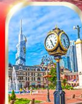
BATUMI CITY ADJARA

เมืองท้ำอุพลิสซิค ■ ป้อมอนาบูรี ■ นั่งกระเช้าชมเมืองบอร์โจนิ อนุสาวรีย์นิตรภาพ รัสเซีย-จอร์เจีย ■ โบสถ์เกอร์เกดี วิหารจวารี ■ มหาวิหารสวตีสคเวลี