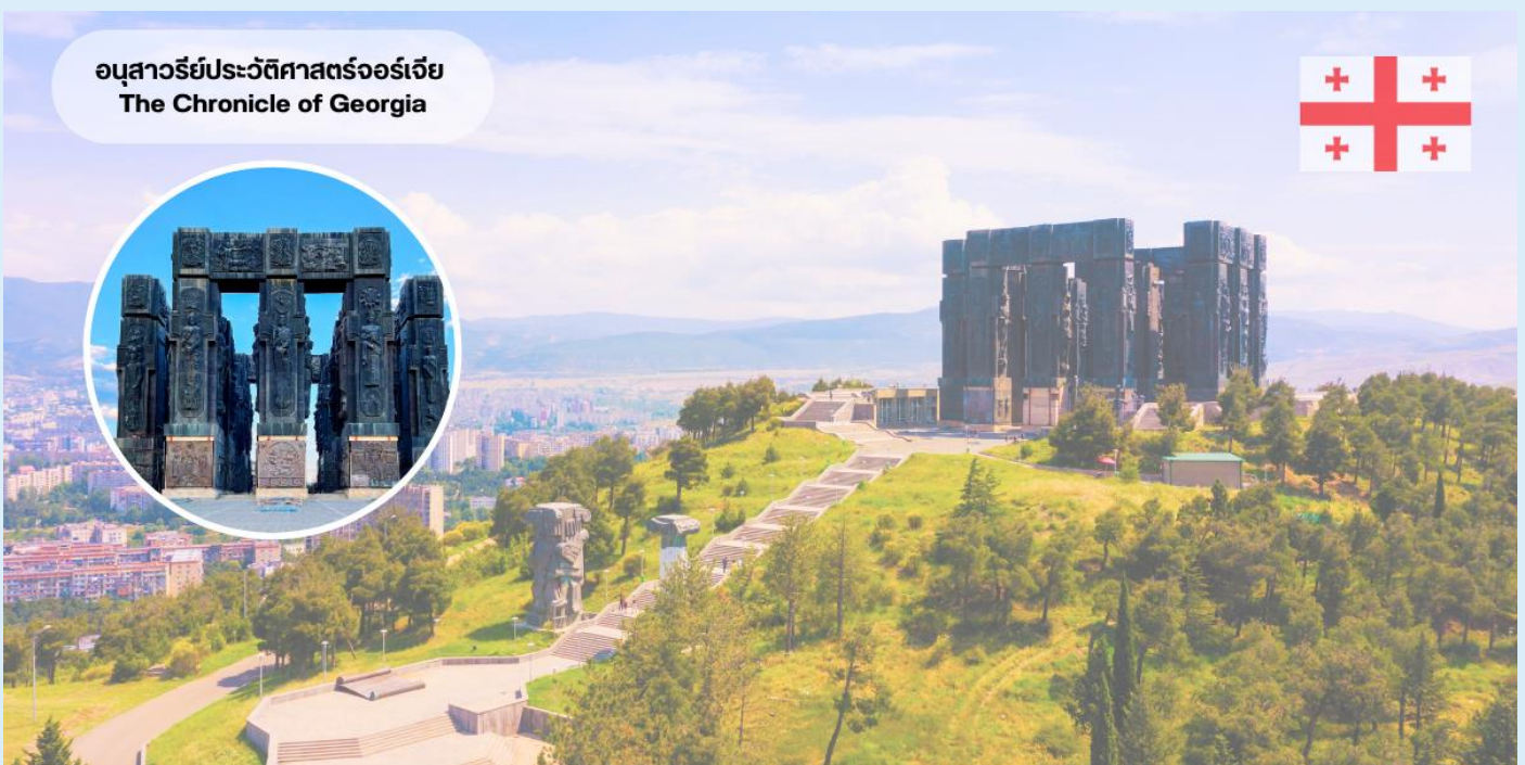
อนุสาวรีย์ประวัติศาสตร์จอร์เจีย The Chronicle of Georgia

ชมความอลังการเสายักษ์ และย้อนรอยประวัติศาสตร์จอร์เจีย “อนุสรณ์ประวัติศาสตร์จอร์เจีย” ได้ชื่อว่าเป็น “ Stonehenge of Georgia “