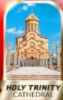
HOLY TRINITY CATHEDRAL