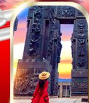
THE CHRONICLE OF GEORGIA