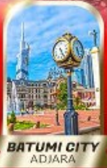
BATUMI CITY ADJARA

เมืองถ้ำอูพลิสซิค ■ ป้อมอนาบูรี ■ นั่งกระเช้าชมเมืองบอร์โจมี อนุสาวรีย์มิตรภาพ รัสเซีย-จอร์เจีย ■ โอสต์เกอร์เกดี วิหารจวารี ■ มหาวิหารสเวทิตสเควซี