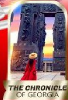
THE CHRONICLE OF GEORGIA