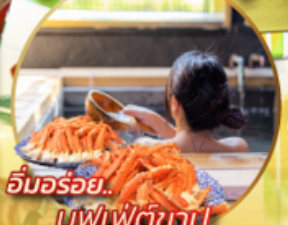
อิมมอร์รี่... บุฟเฟ่ต์ซาซุ