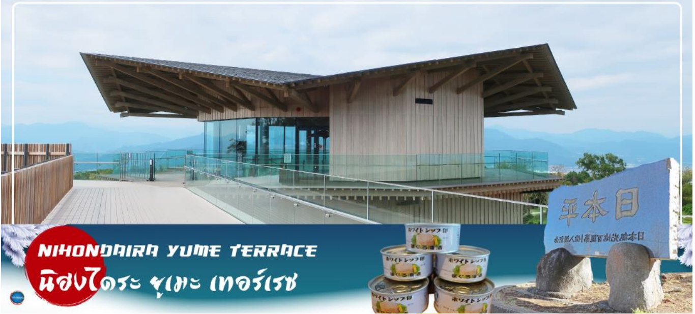
NIHONDAIRA YUME TERRACE นิสงไดระ ยูเมะ เทอร์เรซ