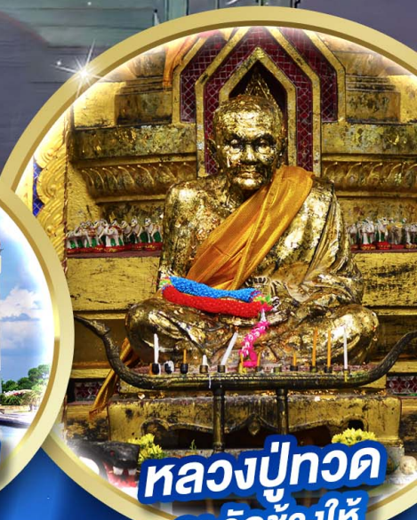
หลวงพ่อทวด ณ วัดช้างให้