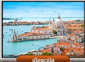
เมืองเวนิส