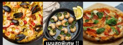
PAELLA ข้าวผัดสเปน / หอยแครงสด / พิซซ่ามาการิตต้า