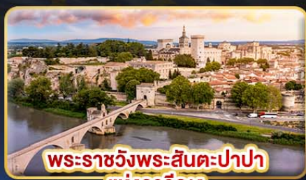
พระราชวังพระสันตะปาปา แห่งอาวิญง