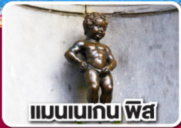
แมนเนเกน ฟิส