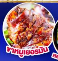
พาหมูเยอรมัน