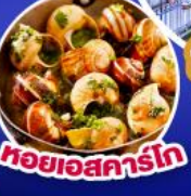
หอยเอสคาร์โก