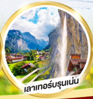
เลาเทอร์บรุนเนน