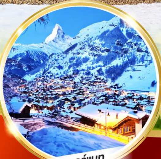
เซอร์แมท