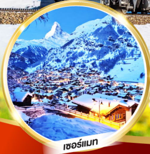
เซอร์แมท