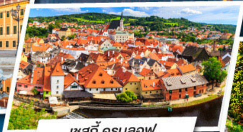
เซสกี ครุมลอฟ