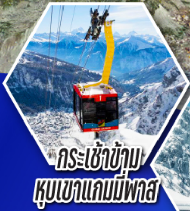
กระเช้าข้าม หุบเขาแคมมีพาส