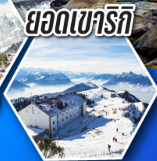
ยอดเขาริก

ชมมหาธารน้ำแข็งยักษ์ อาเลซ กลาซีเยร์ แห่งยอดเขาออกกิสฮอร์น