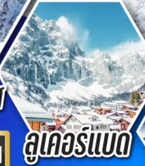
ลูเคอร์แบด