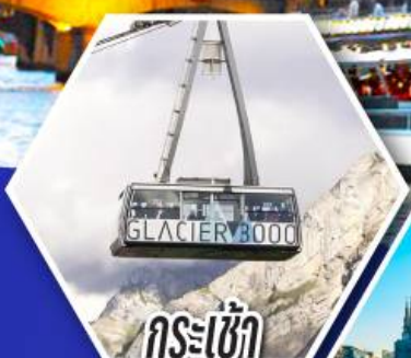
กระเช้า กลาเซียร์ 3000