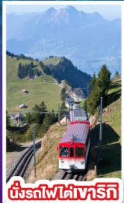
นั่งรถไฟใต้เขาเรทิก